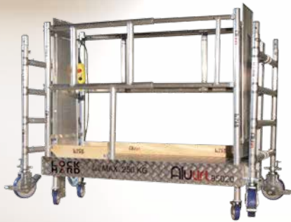
Artikelnr. 100 S