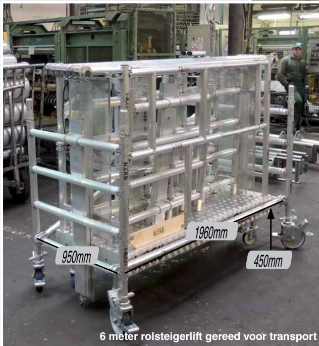
6 meter rolsteigerlift gereed voor transport